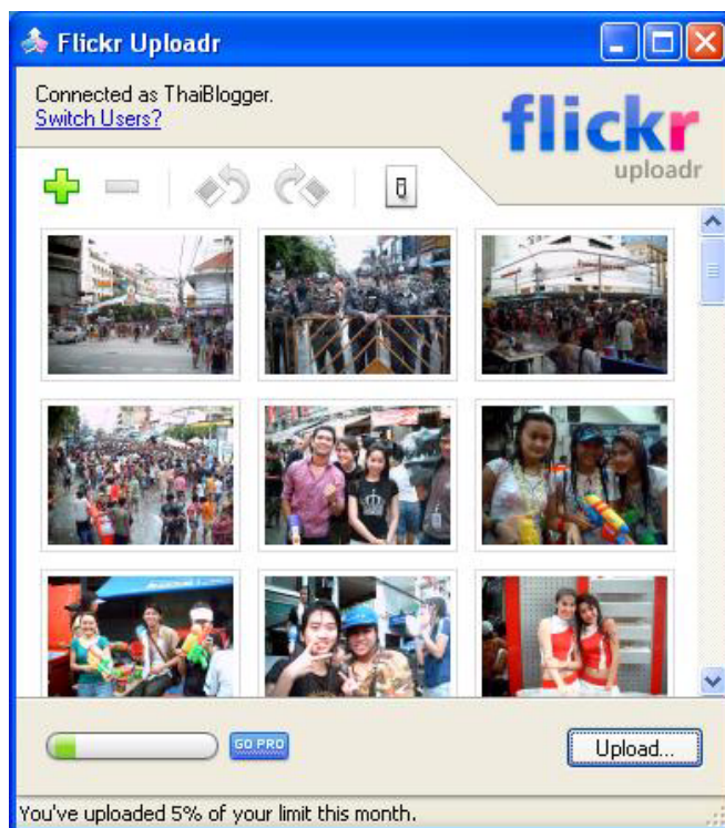
รูปที่ 3 หน้าจอเว็บไซต์ Flickr

อีกบริษัทหนึ่งที่มีลักษณะเดียวกับ YouTube แต่เป็นการแลกเปลี่ยนรูปภาพบนเว็บ คือ Flickr ( www.flickr.com ) โดยเว็บ Flickr ได้รับความนิยมอย่างแพร่หลายทั่วโลก และ Flickr เชื่อว่าคนยุคต่อไปจะใช้เว็บไซต์นี้เพื่อเก็บบันทึกภาพประวัติศาสตร์ของพวกเขาตั้งแต่เยาว์วัยจนตลอดชีวิต และขณะนี้ผู้คนบนชุมชนออนไลน์สามารถร่วมกันสร้างสารานุกรมออนไลน์ที่เรียกว่า Wikipedia ( www.wikipedia.org ) ซึ่งในปัจจุบันนี้ข้อมูลใน Wikipedia มีขนาดใหญ่กว่า Encyclopedia ด้วยซ้ำไป โดยจากสถิติเว็บที่กล่าวถึงเหล่านี้มีผู้คนเข้าถึงนับพันล้านครั้งต่อวัน