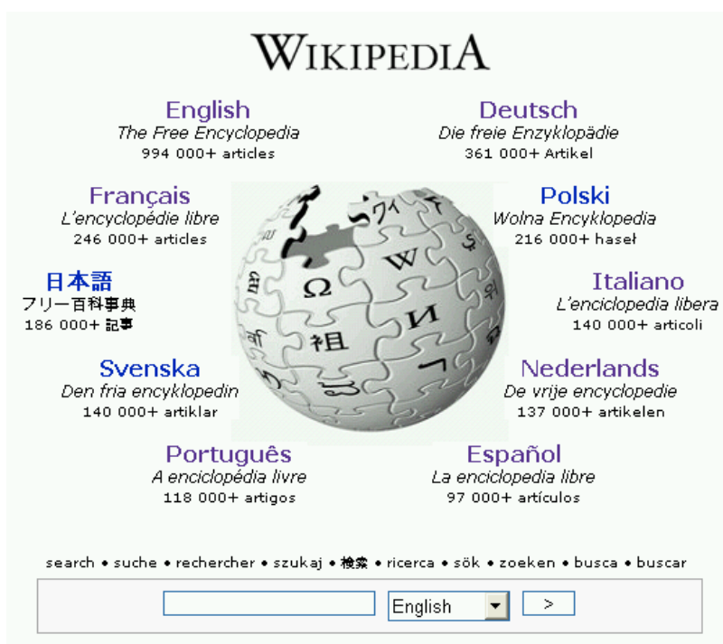
รูปที่ 2 หน้าจอเว็บไซต์ Wikipedia